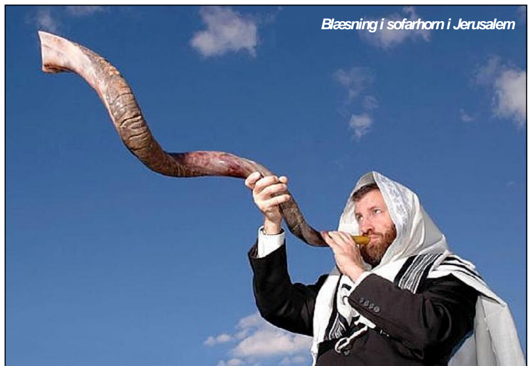
Blæsning i sofarhorn i Jerusalem

"For Herren selv vil, når befalingen lyder, når ærkeenglen kalder og Guds basun gjalder, stige ned fra himlen, og de, der er døde i Kristus, skal opstå først. Så skal vi, der lever og endnu er her, rykkes bort i skyerne sammen med dem for at møde Herren i luften, og så skal vi altid være sammen med Herren. Trøst derfor hinanden med disse ord." (1. Tess. 4:16-17).