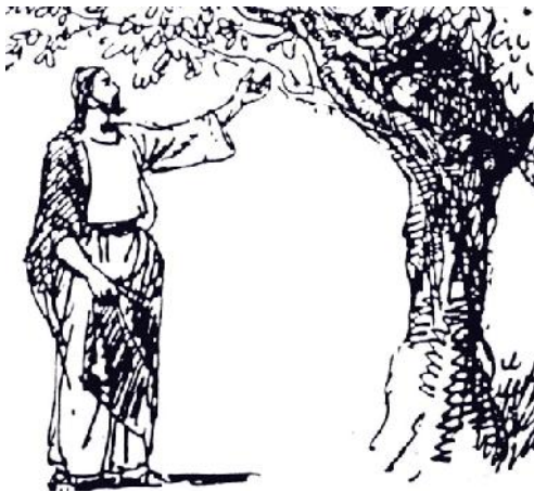
Jesus forbander det ufrugtbare figentræ

3. I Matt. 21:18-20 og Mark. 11:12-14 har vi beretningen om forbandelsen af figentræet med det svigefulde udseende , d. e. med det prægtige løv, men uden frugt . Dette skete i begyndelsen af april måned og det var derfor "ikke figetid" idet det naturligvis var for tidligt for tidligfrugt. Men Jesus håbede at finde umoden senfrugt , som havde overlevet vinteren, noget som dette figentræ med det prægtige løv burde have. Da han ikke fandt frugt, forbandede han det, så det aldrig i evighed skulle bære frugt, og det visnede straks.