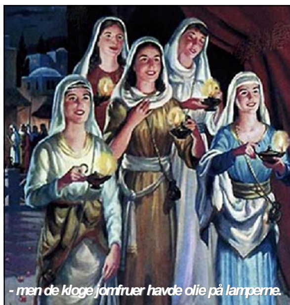
... men de kloge jomfruer havde olie på lamperne.