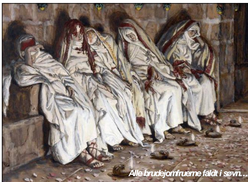
Alle brudejomfruerne faldt i søvn...

Det vil ske i den 70. åruge for Israel (Dan. 9:27), da Israels rest , som på dette tidspunkt også er hele Israel, skal blive frelst . (Rom. 11:26). For de øvrige, vantro israelere bliver ifølge det profetiske ord udryddet i den store trængsel. Men denne antagelse af Israels troende rest vil blive som liv af døde for de rester af folkeslagene, som overlever den store trængsel (Rom. 11:15).