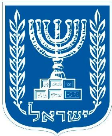
Israels rigsvåben med 2 oliegrene

Dette syn omhandler Israels delvise og foreløbige genoprettelse efter det babyloniske fangenskabs 70 år, men peger fremad mod den fulde og endelige genoprettelse i endens tid. De to olietræer er de to med olie salvede mænd, der dengang var Josva og Zerubbabel , som beklædte henholdsvis det præstelige og det fyrstelige embede. Disse to olietræer gav med deres olie lys til den syvarmede guldlysestage, som er symbol på den nytestamentlige menighed. Israel, som var verdens lys i den gamle pagts tid, var betroet dette nytestamentlige lyssymbol, men under templets dække.